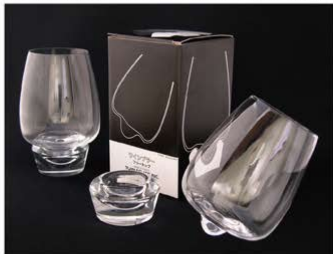
※実用新案・意匠登録出願済

意外と知られていませんが日本一の生産量を誇る手造りガラスのメッカ東京。江戸に於ける硝子産業は、18世紀初めに鏡、眼鏡、簪、風鈴等を製造したのが始まりとされています。その後、江戸の技術を継承しつつ明治に入ると新しい知識や技術を欧米から導入し、地場産業として大正、昭和と発展してまいりました。平成に入り14年に江戸硝子の名称で東京都より伝統工芸品の指定を受け今日に至っています。その中で田島硝子は創業以来50余年、様々なお客様より時代にあったモノづくりの要請を受け、今日まで約1万アイテムの製品を作り続けてきました。素材を熟知した江戸硝子のメーカーならではの粋と技が冴えるオリジナル商品をお選びください。