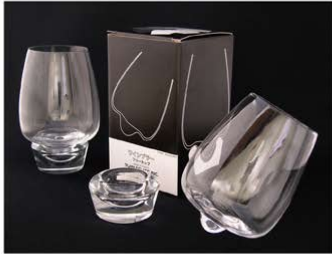
※実用新案・意匠登録出願済

意外と知られていませんが日本一の生産量を誇る手造りガラスのメッカ東京。江戸に於ける硝子産業は、18世紀初めに鏡、眼鏡、簪、風鈴等を製造したのが始まりとされています。その後、江戸の技術を継承しつつ明治に入ると新しい知識や技術を欧米から導入し、地場産業として大正、昭和と発展してまいりました。平成に入り14年に江戸硝子の名称で東京都より伝統工芸品の指定を受け今日に至っています。その中で田島硝子は創業以来50余年、様々なお客様より時代にあったモノづくりの要請を受け、今日まで約1万アイテムの製品を作り続けてきました。素材を熟知した江戸硝子のメーカーならではの粋と技が冴えるオリジナル商品をお選びください。