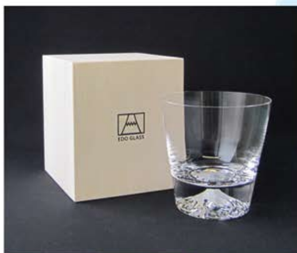
TG15-015-R ロックグラス / 口径 92×高さ 95mm 280cc ¥5,000(税抜き) 箱サイズ / 105×100×102mm