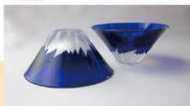
TG13-013-1B 彫刻硝子青富士（1ヶ木箱入り） ¥4,000 箱サイズ：102×102×H50mm