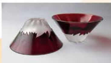
TG13-013-1R 彫刻硝子赤富士（1ヶ木箱入り） ¥4,000 箱サイズ：102×102×H50mm