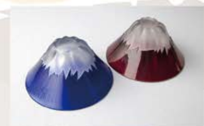
TG13-013-2 彫刻硝子青赤富士セット（木箱入り） ¥8,000 箱サイズ：100×192×H50mm