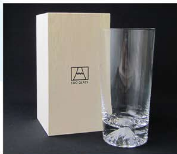
TG15-015-T タンブラー / 口径 76×高さ 150mm 380cc ¥5,000(税抜き) 箱サイズ / 90×170×88mm

このガラス器は、人工吹き(手づくり)で作られていますので、サイズ、重さなどに多少の違いが生じます。